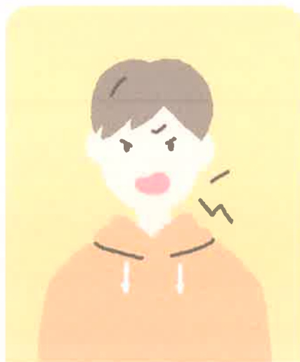
怒りやすくなった